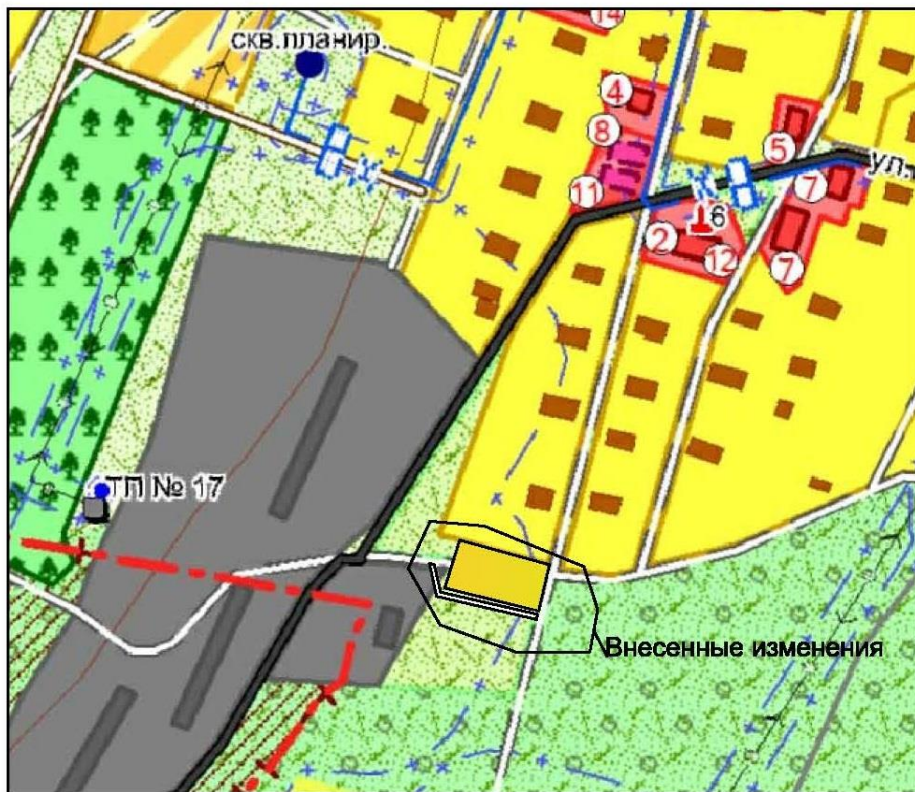
Ситуационный план земельного участка д. Лапта, ориентир на юг от дома по ул. Центральная д. 36